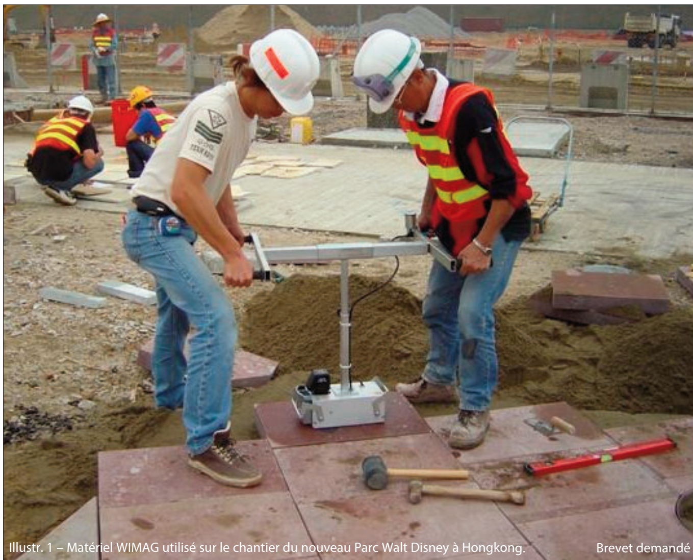
Illustr. 1 – Matériel WIMAG utilisé sur le chantier du nouveau Parc Walt Disney à Hongkong.